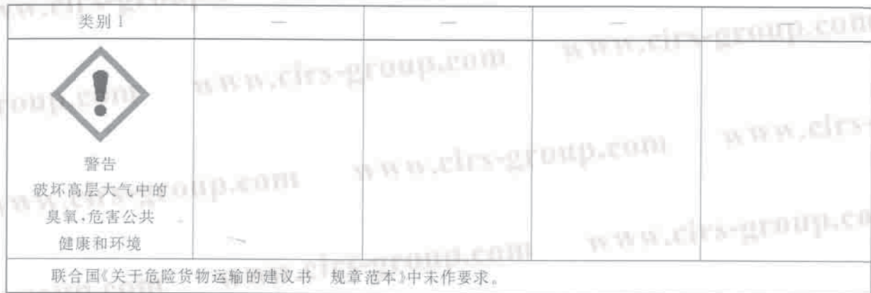
表 C.1 危害臭氧层标签要素的分配