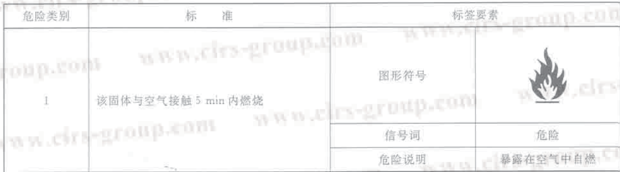
表 C.1 自燃固体分类标准和标签要素