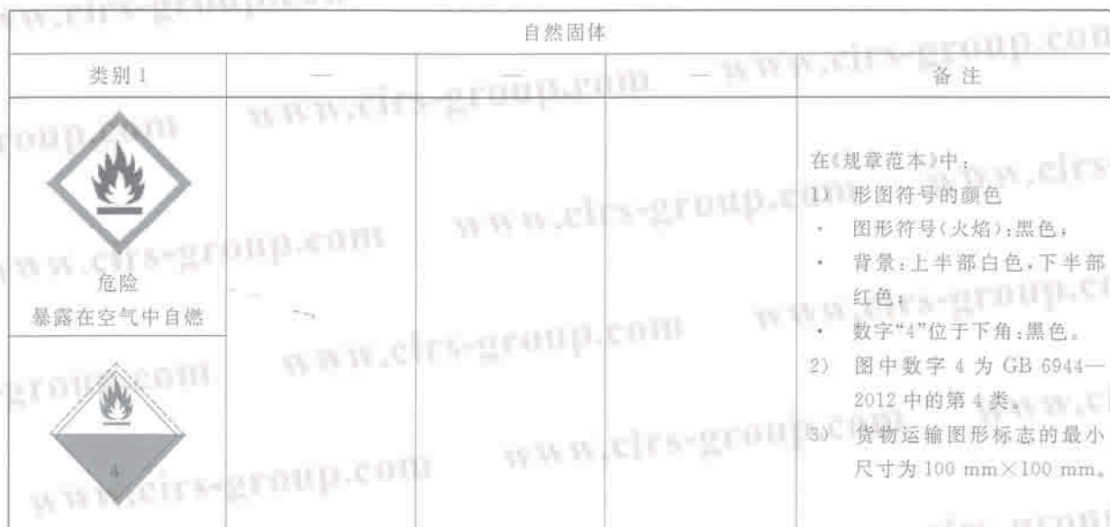
表 B.1 自燃固体标签要素的分配