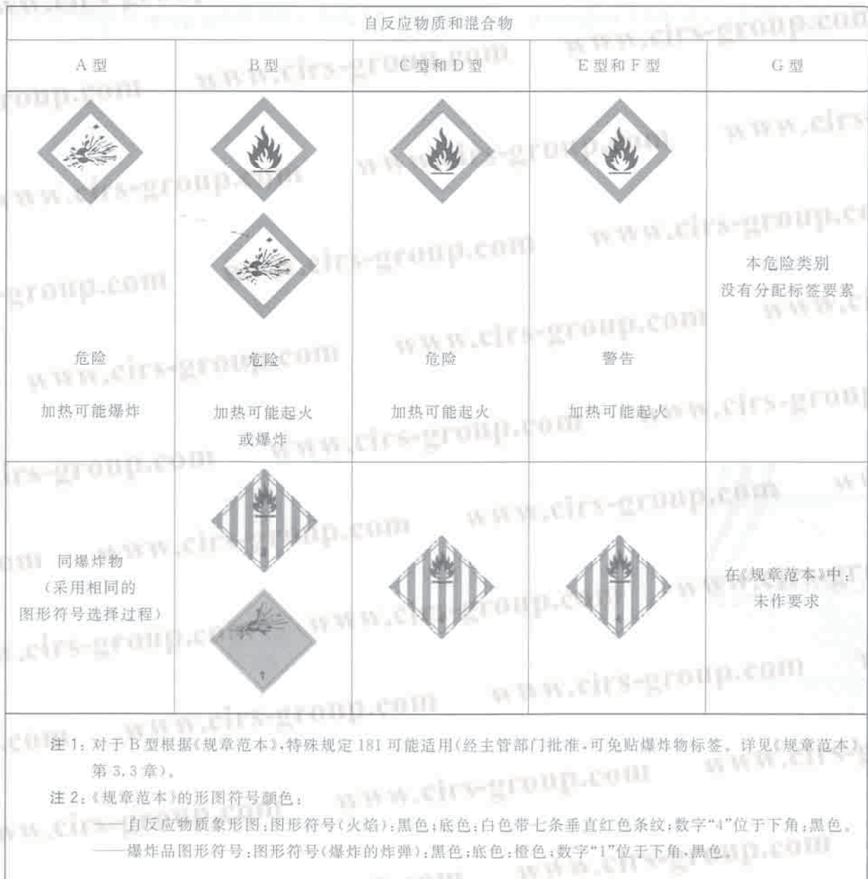
表 B.1 自反应物质和混合物标签要素的分配