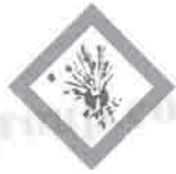
运输象形图 同爆炸物 (采用相同的图形符号选择过程)