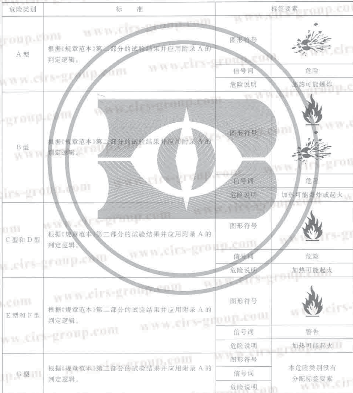
表 C.1 自反应物质和混合物分类标准和标签要素